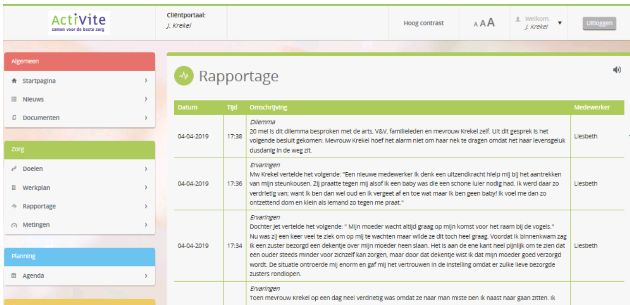
Figuur 4: Rapportage

Medewerkers rapporteren om de voortgang van de zorgverlening over te dragen aan een collega. Heeft u vragen over wat er geschreven is, dan kunt u contact opnemen met de betreffende verzorgende of verpleegkundige.